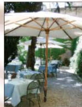
Il ristorante "La Perla del Palazzo" con giardino panoramico