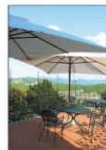
Il terrazzo, che sovrasta il Chianti