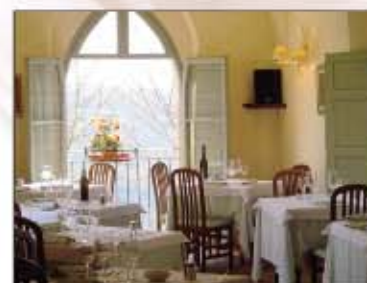
Interni finemente arredati